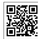
外国人労働者向け安全衛生視聴覚教材 (「職場のあんぜんサイト」厚生労働省)