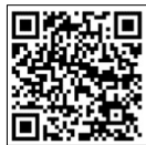
外国人建設就労者のための 安全衛生教育映像教材 (建設業労働災害防止協会)